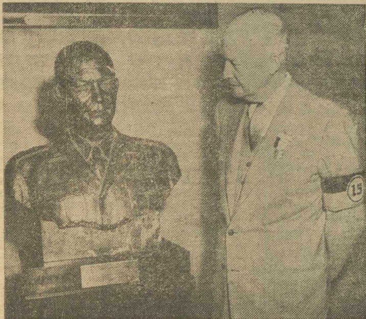
El presidente Eisenhower examina en la Academia Militar de West Point, (Nueva York), un busto suyo hecho por el famoso escultor americano Jo Davidson recientemente regalado al Museo de la Academia.