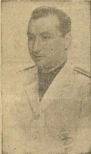
El presidente del Congreso, don Bernardo Cuenca Cerveró, que pronunció el discurso de apertura

En lugares preferentes se encontraban diversos miembros del Consejo Provincial de F.E.T. y de las J.O.N.S., los vice-secretarios provinciales de Ordenación Social de las cinco provincias participantes y los jefes de los Sindicatos Provinciales de esta C.N.S., así como otras representaciones. Comenzó el acto con unas palabras previas del secretario del Congreso y vicesecr-