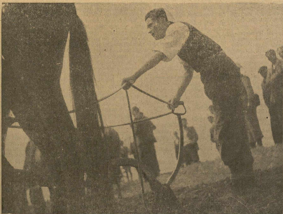
El mozo acudió al concurso de arada, para disputar el trofeo al suero de mejor traza. Atento el músculo, aguarda la señal de la competición que, luego, él, a solas en el inmenso paisaje del cielo y la llanura, continuará con un bagaje de ilusiones para ofrecer un lecho prometedor a la simiente.