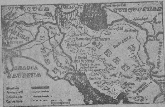
Mapa de Irán, en cuya zona norte se desarrollan los sucesos revolucionarios que han puesto tirantez en las relaciones entre Persia y los soviets. — La zona rayada verticalmente señala, aproximadamente, el teatro actual del levantamiento "nacionalista azerbaidjano".

Londres. — Se anunció que los médicos británicos y los Estados Unidos han logrado la penicilina a través de tres generaciones. Se ha logrado el producto sintético el de los hongos su más tiempo su producción.