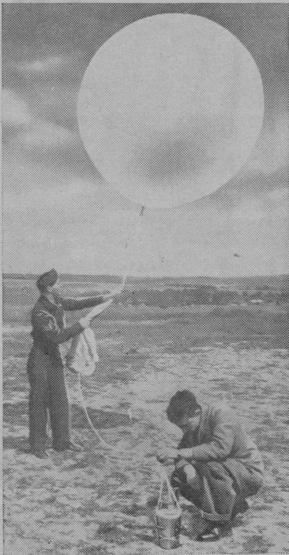
Un globo perteneciente a una Sección Meteorológica de la RAF, listo para ser lanzado a la estratosfera. Al llegar allí el globo se incendia y entonces se abre un paracaídas que trae felizmente a tierra el aparato de las sondas-de-radio