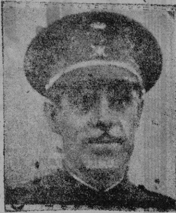
El nuevo Capitán General de Baleares, don Carlos Asensio Cavanillas

El Hipódromo será abierto a las dos y media de la tarde, y la primera prueba comenzará exactamente a las 2:55.