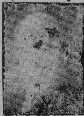
D. Domingo de las Barenas, nuevo Embajador de España en Inglaterra