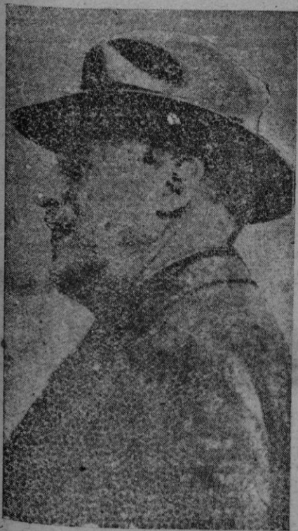
El Secretario de Guerra de los E.E. U.U. Stimson, uno de los principales propulsores de la bomba atómica