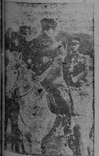
El Emperador del Japón