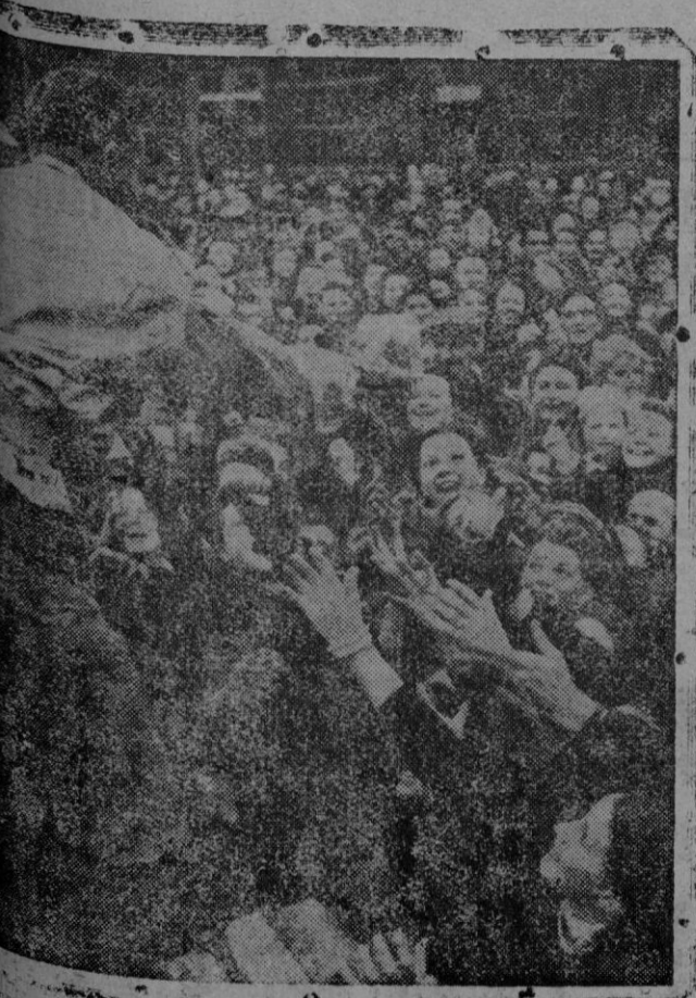
Entre las ávidas manos de los ciudadanos de Metz...