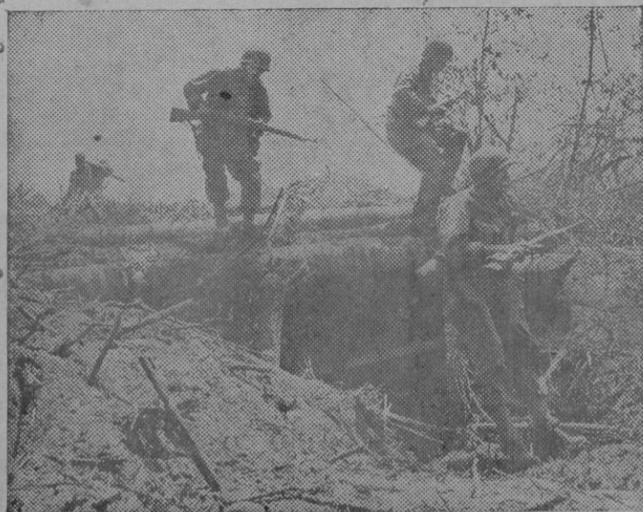
Con sus fusiles dispuestos para la acción, los soldados norteamericanos saltan sobre una casamata japonesa, durante su penetración en la isla de Leyte, que acaban de conquistar.