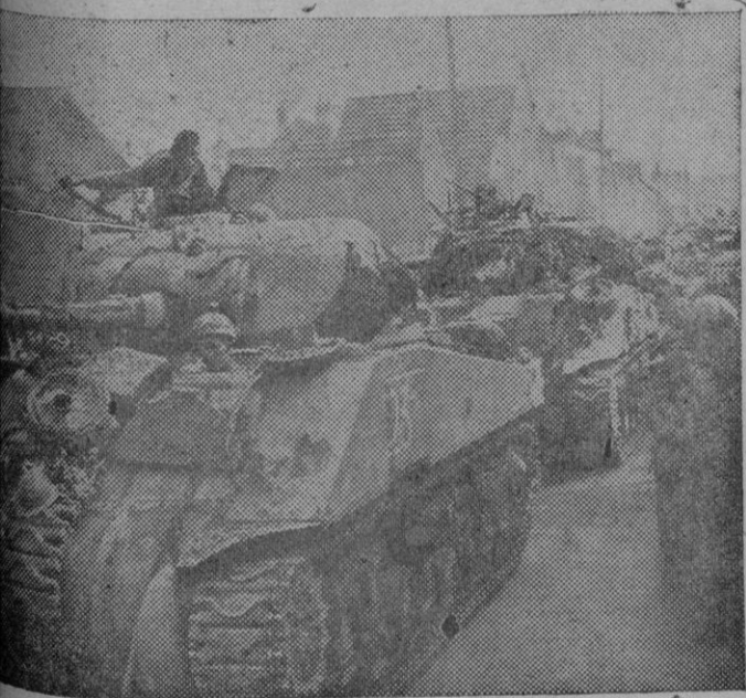
Una columna de tanques británicos camino del frente