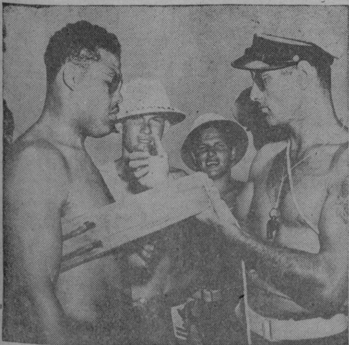
El campeón mundial de boxeo, Joe Louis, Sargento de Estado Mayor del Ejército norteamericano, recibe instrucciones para el uso del soplete en una base naval americana del Norte de África