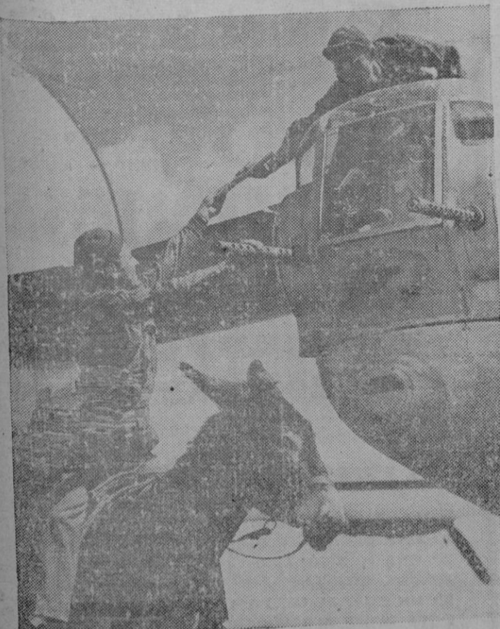
Un sargento del Ejército americano hace la distribución de la correspondencia entre los soldados norteamericanos de aquel sector en un borriquito