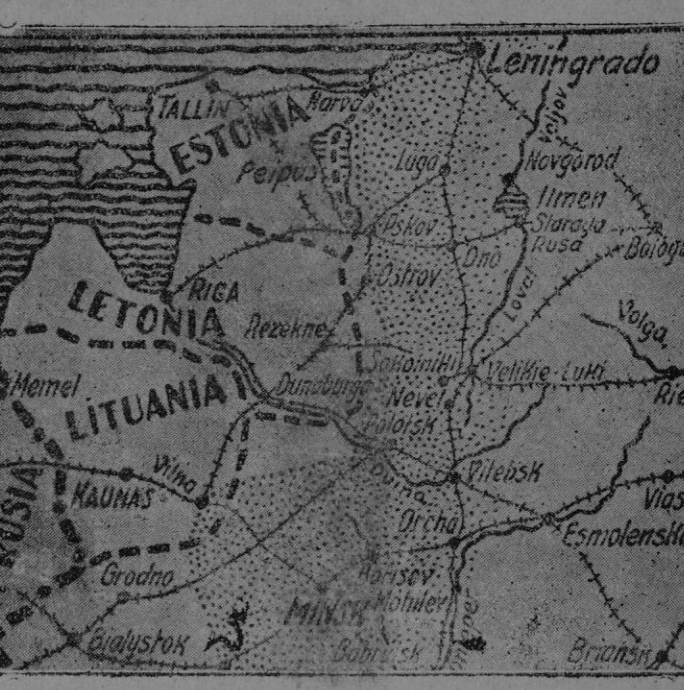
El avance soviético. — Las tropas de Stalin han entrado en territorio lituano, en el sector de Vilna