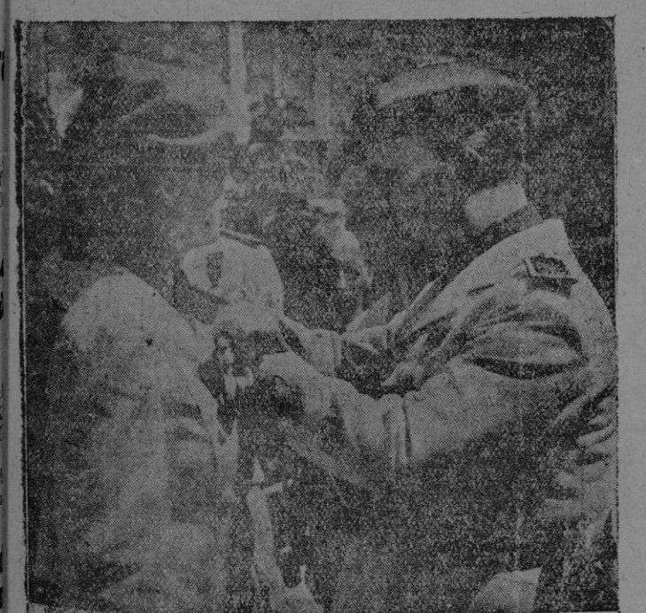
El Caudillo imponiendo las decoraciones a las camaradas premiadas