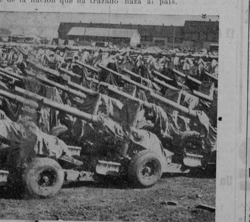
Como los aliados preparaban la invasión. — Un parque de cañones británicos, dispuestos para ser trasladados

Berlín. — Alemania aprueba rotundamente el discurso pronunciado ayer por el Presidente del Consejo finlandés, Linkomies, que constituye un acto de fe de la nación que ha trazado