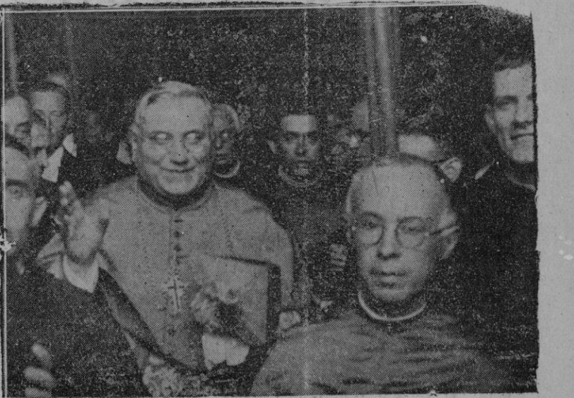
El Nuncio de S. S. al salir de la Basílica de San Francisco, después de la función del domingo