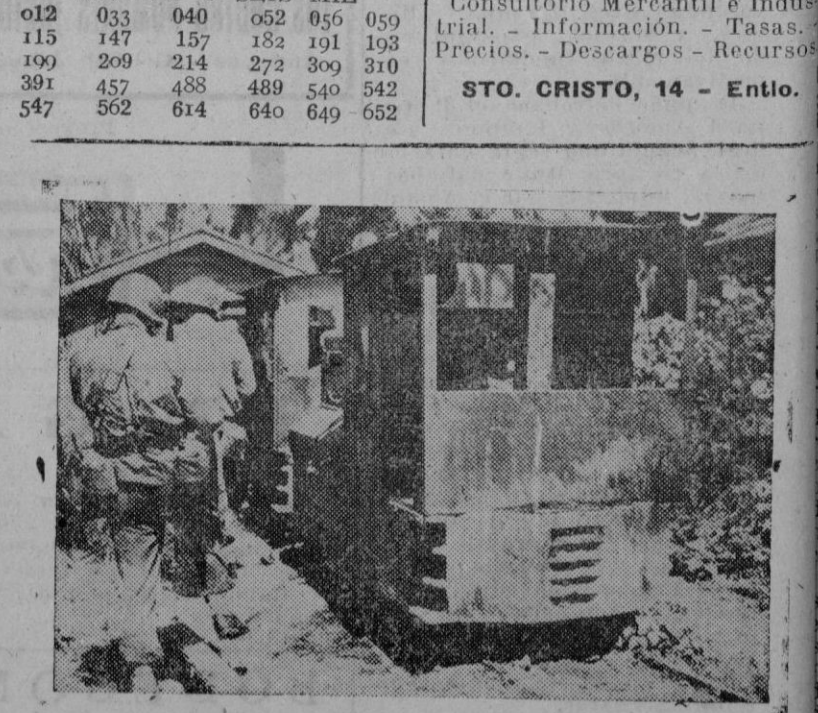
La ocupación del Atolón de Majuro. — Soldados americanos contemplando los locomotoras de un ferrocarril de vía estrecha, halladas en el Atolón de Majuro al ser ocupado