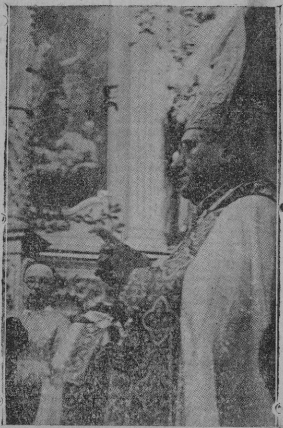
El Nuncio de S. S. al bendecir los atributos de la Basílica

Atendiendo a la invitación publicada fueron muchísimos los balcones y ventanas de nuestra ciudad que lucieron colgaduras, entre ellas, como es tradicional en ese día, la Casa Consistorial, en cuya tribuna figuraba el cuadro de gran tamaño de la gloria máxima de Mallorca. A la hora de empezar el solemne Pontifical, la Basílica de San Francisco se hallaba materialmente atestada de fieles, luciendo su espléndida iluminación, todo el tiempo que duró el suministro de fluido eléctrico. A la llegada del Nuncio Mons. Ciognani, fué recibido con cálidas muestras de afecto por parte del numeroso público congregado, en la P. de San Francisco; saludado por las Autoridades que aguardaban su llegada penetró en el templo bajo palio, precedido del aínánulo, acompañado del prelado Dr. Miralles, tomando asiento sobre el presbiterio, en la parte del Evangelio, haciéndolo al lado de la Epístola el Arzobispo-Obispo.