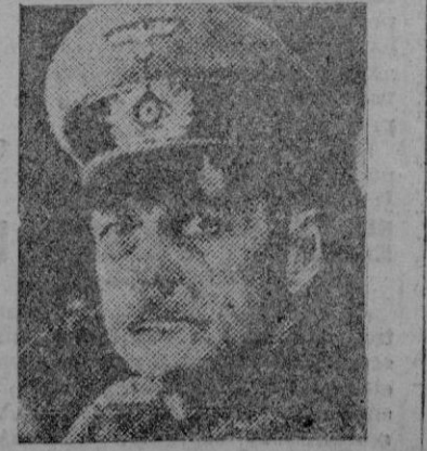
El mariscal Von Rundsted, jefe de las fuerzas alemanas en Francia

Las malas condiciones atmosféricas — dice — permiten deducir amplias conclusiones acerca del programa de operaciones de gran estilo. Los vientos intensos, la mar agitada, la capa de nubes a poca altura así como las numerosas ráfagas de lluvias, no se han tenido en cuenta, porque el programa de invasión fijaba la fecha del 6 de Junio. Las escuadras aéreas, cuya misión era guardar el espacio, no han podido operar más que a alturas muy pequeñas, quedando expuestas al fuego de la DCA alemana. Muchos centenares de navíos de desembarco han tropezado con grandes dificultades. De la misma manera, las unidades de desembarco y asalto con poco calado, con los puentes abiertos y llenas de soldados armados, se veían obligadas a concentrar la atención en el mar y no en la ejecución rápida de la misión de desembarco. Los barcos tuvieron que ser protegidos desde el primero al último momento, por niebla artificial, y la niebla dificultó la visibilidad no solo de las unidades de desembarco, sino también de las fuerzas de protección. Por otra parte, la niebla ocultaba a la formación naval, que ofreció un blanco excelente para las fuerzas alemanas. El artillista termina diciendo que Eisenhower no podía decidir otra cosa más que la continuación de las operaciones. Si hubiera elegido una noche oscura y brumosa, sin luna, como las que ha habido en los últimos días hubiera contado a la naturaleza entre sus aliados. Pero de esta manera se ha manifestado como su enemiga. (Sigue en 4.º pág.)