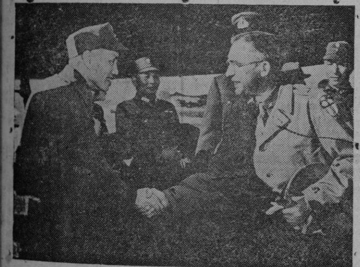
El Generalísimo Chiang-Kai-Shek saluda al General de Brigada Me Cabe, durante la visita a un centro de instrucción del Ejército americano en la India Oriental.

Hay que retornar las masas, que se volcaron sobre las ciudades, al campo, para fecundarlo con su labor; y para atracción, la valoración de los productos de la tierra, otro aspecto de las saludables medidas que va tomando el Gobierno del Caudillo para lograr que quien labra la tierra no tenga nada que envidiar al que coloca ladrillos en las ciudades, arregla calles o carga carros, que es la labor para la que no precisa de aprendizaje y a la que se entregan los que huyen del campo e invaden las capitales.