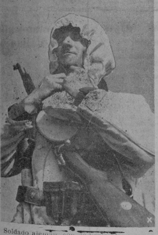
Soldado alemán, con la vestimenta blanca, para la lucha en el territorio nevado

Madrid. — El Servicio de Estudios, del Ministerio de Agricultura, ha hecho público un resumen de la situación del campo y sus cosechas, en las provincias españolas, las que refieren a fines de febrero. En primer lugar, figura la impresión global de las cosechas en todo el país; luego, datos detallados de cada una de las provincias. En la impresión general se reflejan los dañosos efectos ocasionados en el campo por la gran sequía sufrida desde diciembre último. El régimen de lluvias iniciado a últimos de febrero, ha deshecho en parte los temores que se sentían por las futuras cosechas del presente año. Si no vuelve de nuevo el régimen de sequía, no serán grandes los daños de la pasada, pues en cambio mantuvo a los campos limpios de malas hierbas y los grandes frios han contrarrestado en parte los malos efectos de aquella. Las heladas han causado daños especialmente en los frutales, no muy grandes en los naranjos y mayores en los almendros, pues alcanzó a estos en el momento de su floración. La situación de la ganadería es bastante difícil, a causa de la sequía y las heladas que han reducido al mínimo los pastos y por la escasez de los piensos. En Baleares la situación es la siguiente: Cereales y leguminosas. — En las zonas más cálidas comienza la siembra de los garbanzos y continúan las labores de escarda en las sementeras de habas y guisantes. Los habares presentan buen