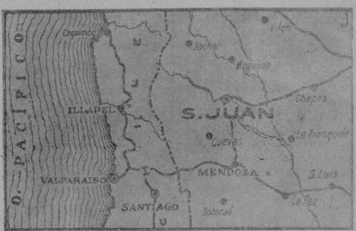
La provincia de San Juan, donde se han registrado los terribles terremotos