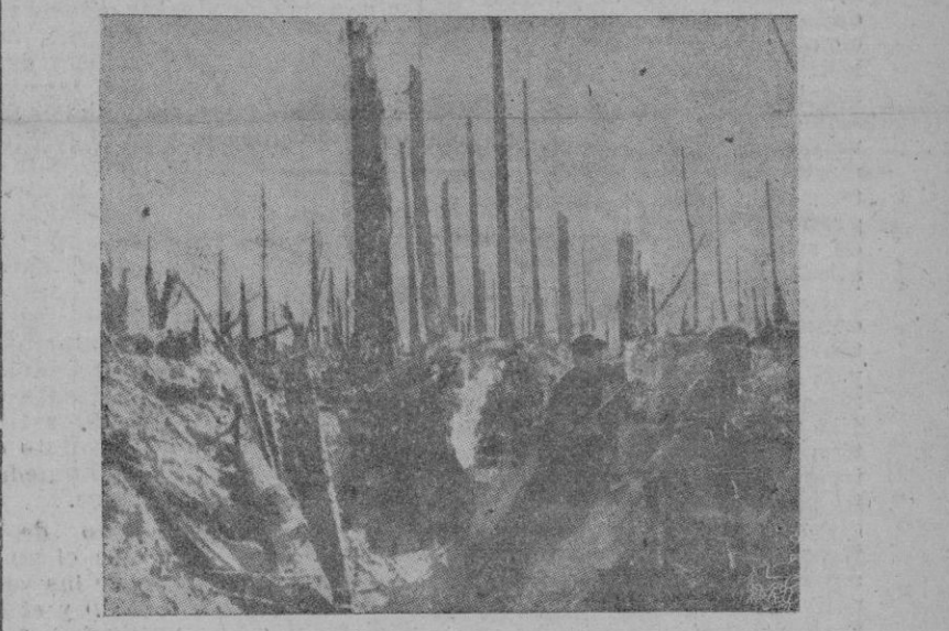
Esto era un bosque en el frente ruso: han queda-do solamente los troncos, como esqueletos, testi-gos de la horrosa lucha