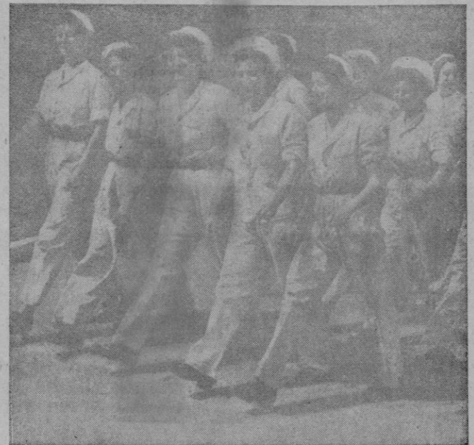
En los países en guerra las mujeres sustituyen a los hombres en muchas labores. — Grupo de muchachas inglesas que trabajan en las panaderías para suministrar al Ejército

LAS LANCHAS ALEMANAS DESTRUYEN UN DESTRUCTOR Y UN MERCANTE DE 7000 TONELADAS Berlín. — En el litoral norte de Sicilia aviones alemanes rápidos, destruyeron el 7 de Agosto un destructor y un mercante enemigo de 7.000 toneladas. Fueron además bombardeados eficazmente unidades de desembarco."