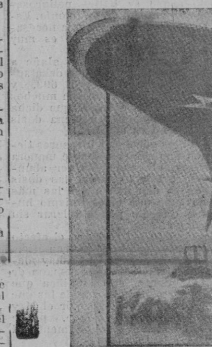
Avión de bombardeo norteamericano. Los hombres que lo empujan dan idea del enorme tamaño del avión

Roma. - En el bombardeo de esta ciudad ha perecido el comandante de las tropas de policía italiana Hazon y el jefe de su estado mayor, coronel Barenzo, se anuncia oficialmente.