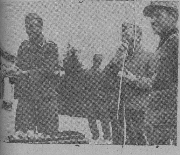
Soldados del frente se aborean la fruta fresca

La disposición, dictada por el "gauleiter" Sauehel, establece que las vacaciones no podrán comenzar a fin de semana para evitar una mayor congestión en el tráfico ferroviario, tan intenso los sábados y domingos.