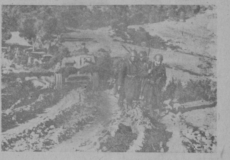
Infantería italiana sigue a los tanques alemanes y protege el terreno ocupado en el frente de Túnez

4.000 PRISIONEROS ANGLOSA-JONES Y UN GRAN BOTIN. - SE INTENTA COGER POR LA ESPALDA AL PRIMER EJERCITO BRITANICO. - LA RETIRADA NORTEAMERICANA. Berlín. - La operación ofensiva germano italiana desencadenada desde hace ocho días, en la parte SO. de Túnez, ha terminado, por ahora, con la ocupación de importantes pasos.