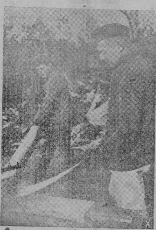
Centenares de tejas del mismo grueso son fabricadas para los techos de las casas que para los combatientes se levantan en el frente del Oeste

Madrid. — El Boletín Oficial del Estado publica: Educación Nacional. Orden disponiendo la provisión de la cátedra de Alemán en la Escuela Profesional de Comercio de Palma de Mallorca, que se anuncia por concurso previo de traslado entre los catedráticos numerarios.