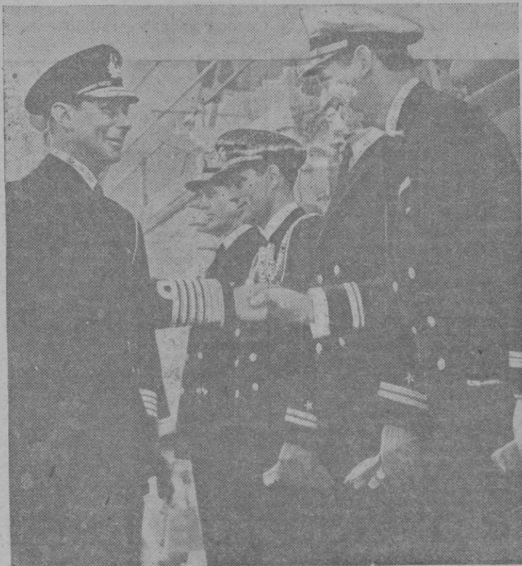
El Rey Jorge VI visita algunas unidades de la Flota de los Estados Unidos en aguas británicas

Presentad vuestra solicitud durante el corriente mes de Enero en la Delegación Provincial de la Caja Nacional de Subsidios Familiares.