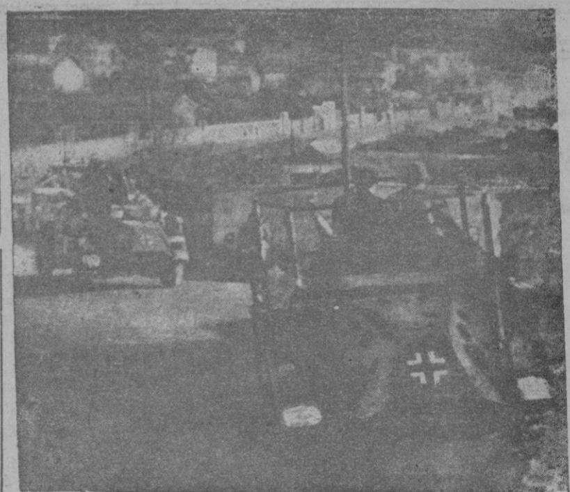
Las fuerzas alemanas a su entrada en Marsella