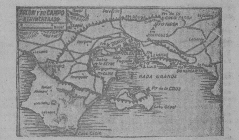
Tolón: Primer puerto militar de Francia