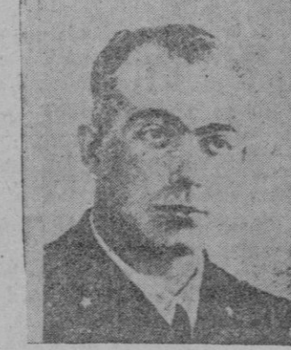
El teniente de navío Enzo Grossi, comandante del submarino italiano "Barbarigo", que hundió un buque americano de línea del tipo "Missisipi"

MADRE! Un medicamento que crees inofensivo, un simple purgante, puede ser fatal si es usado tempestivamente. ¡NO purgues nunca a tu hijo sin consejo del médico!