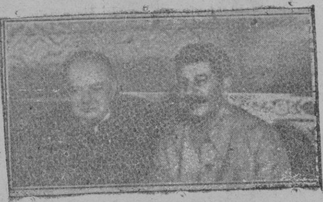
Stalin, en la entrevista que celebró con Churchill

A primera hora de la tarde habló desde los micrófonos de la Delegación de Prensa de la Vicesecretaría de Educación Popular, el Delegado Provincial de Ex-cautivos, quien dirigió una alocución a todos los caballeros de España.