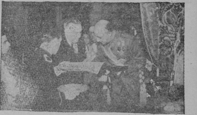
El Generalísimo Franco en el momento de firmar en el acta de consagración de la Cámara Santa

Washington. — El racionamiento de gasolina y restricciones draconianas sobre el empleo de automóviles de turismo son medidas que ha propuesto Roosevelt al Comité especial de carburantes. Roosevelt ha declarado que se pondrán prácticas proposiciones tan pronto como puedan tomarse disposiciones oportunas.