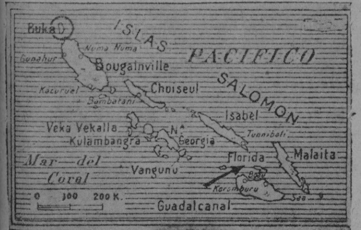
En aguas de las islas Salomón se ha desarrollado el combate naval entre japoneses y norteamericanos

Tales directrices, lógicas y equitativas, son una nueva demostración del acierto con que proceden quienes consagran sus esfuerzos a la gobernación y guía rectora de la Nación.