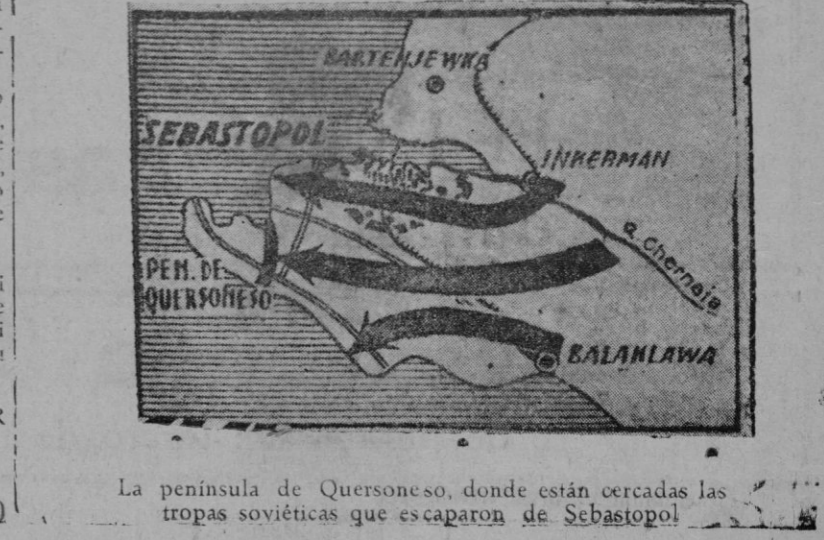
La península de Quersoneso, donde están cercadas las tropas soviéticas que escaparon de Sebastopol

Rio Janeiro. - El primer Congreso Interamericano de lucha contra la guerra ha comenzado bajo la presidencia del Ministro de Sanidad del Brasil.