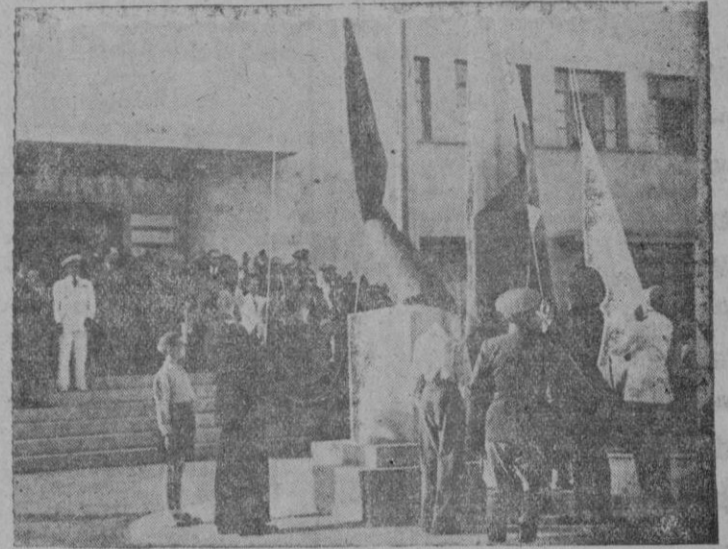
Las primeras autoridades izando las banderas Nacional y del Movimiento