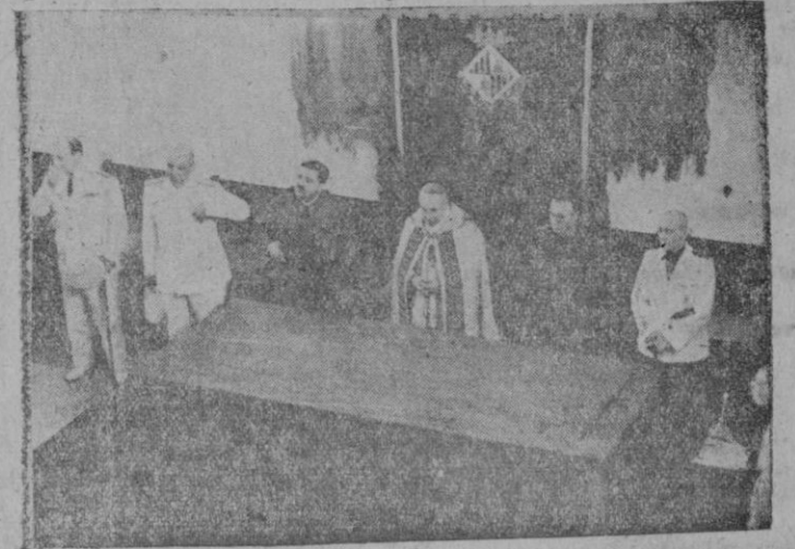
Las primeras autoridades en la presidencia