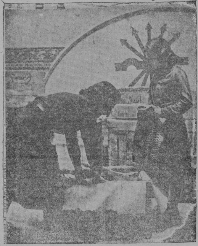
Las muchachas de Falange embalan los donativos, prendas de abrigo, dulces, vinos, viandas, para el Aguinaldo de la División Azul

La autarquía llevada al extremo, es sólo cosa transitoria, como declara el Ministro de Economía del Reich: Mirádonos en este espejo, cultivámoslo ahora, pero preparados para el intercambio de productos, para que en la Argentina el trigo que tiene que dar a las bestias o se pudre en los graneros ahora, vuelva a llenar las necesidades nuestras, así como el café que queman en el Brasil, y nosotros podamos darles, como antes de la guerra, nuestros aceites, naranas, frutas; siendo entonces, un problema de transportes el equilibrio en el abastecimiento de las naciones.