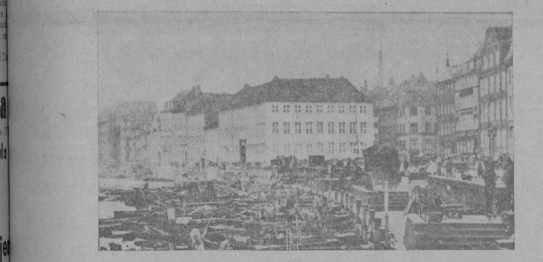
La ciudad de Copenhague que han ocupado los alemanes