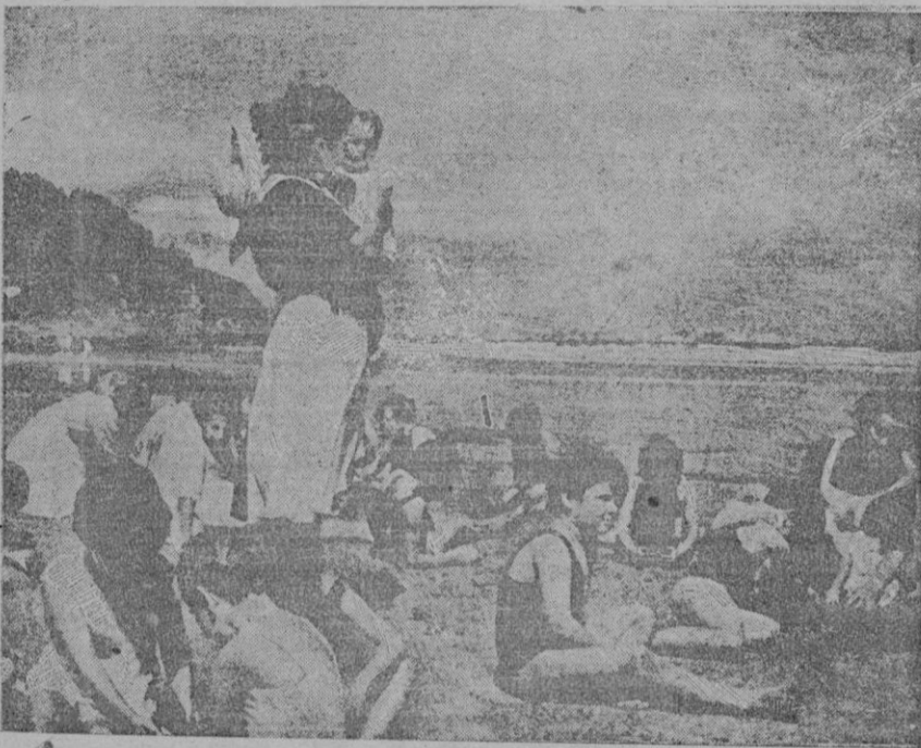
Las camaradas de Auxilio Social van a los pequeñuelos al mar para que el aire y el sol fortifiquen sus cuerpos

La obra "Madre y Niño" lleva a la práctica la política del Estado nacional-sindicalista, elevando el nivel de salud y de cultura de las madres, moldeando una infancia fuerte y alegre y confiando a los hogares pobres la ayuda necesaria para el logro