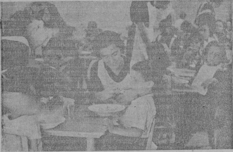
Las camaradas de Auxilio Social dando de comer a los pequeñuelos

A partir de hoy, la Delegación Provincial de "Auxilio Social", ampliará su órbita de acción, con una nueva obra, que es tan hermosa y patriótica o quizás más que todas las realizadas hasta la actualidad. Se trata de la obra nacional-sindicalista de protección a la madre y al niño, bajo el lema: "Por la Madre y el Hijo, por una España mejor"; pues entrará de lleno en el campo de sus actuaciones definitivas, amparando moral