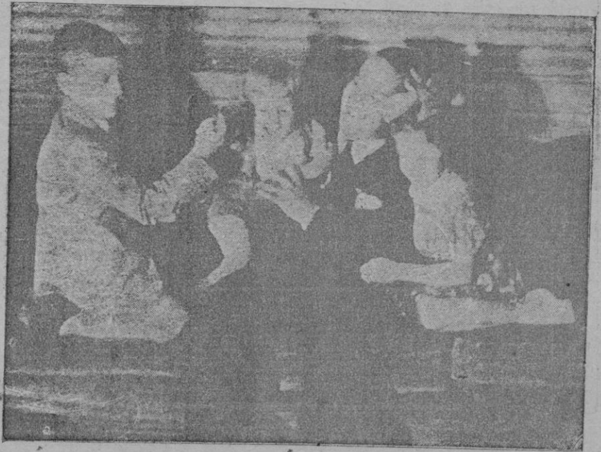
En las breves treguas de su fatigosa labor y trascendentales preocupaciones S. E. el Conde Ciano busca la tranquilidad en los serenos gozos familiares y en la paz de su hogar

Hoy es el Día de los Caídos y para homenajear a los que lo dieron todo por Dios y por España, deben lucir en los balcones las colgaduras que tantas veces lucieron en señal de victoria.