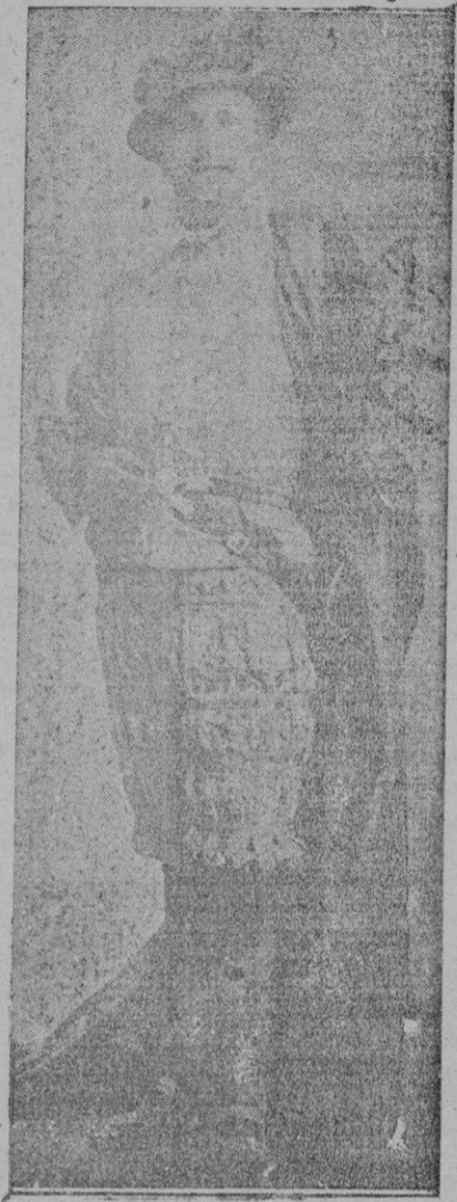
Enrique Borrás en Don Juan Tenorio

Véase, pues, como en los destinos del Teatro, propiamente dicho, se debilita hasta llegar al borde de perecer, todo un contenido, todo un patrón de un género con raíces clásicas que tuvo la virtud de hacer revivir, en la conmemoración de una fecha, el personaje creado por Zorrilla que tanto parecía complacer a sus admiradores, que se recreaban, siquiera una vez al año, con los sonoros versos de la obra y con las audacias del protagonista.