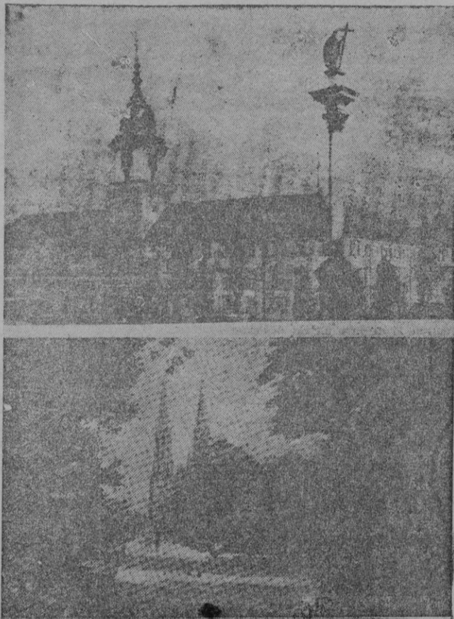
Arriba: El Palacio real de Varsovia, residencia que era del Presidente de la República Abajo: Jardines de Varsovia, con la iglesia de San Florian al fondo

"A primeras horas de la mañana de hoy, los aviones de la "Royal Air Force" realizaron una cuarta incursión de vuelos de reconocimiento por Alemania con el objeto de distribuir nuevas proclamas dirigidas al pueblo alemán. El raid se ha efectuado con éxito, habiendo sido arrojados desde los aviones ingleses tres millones y