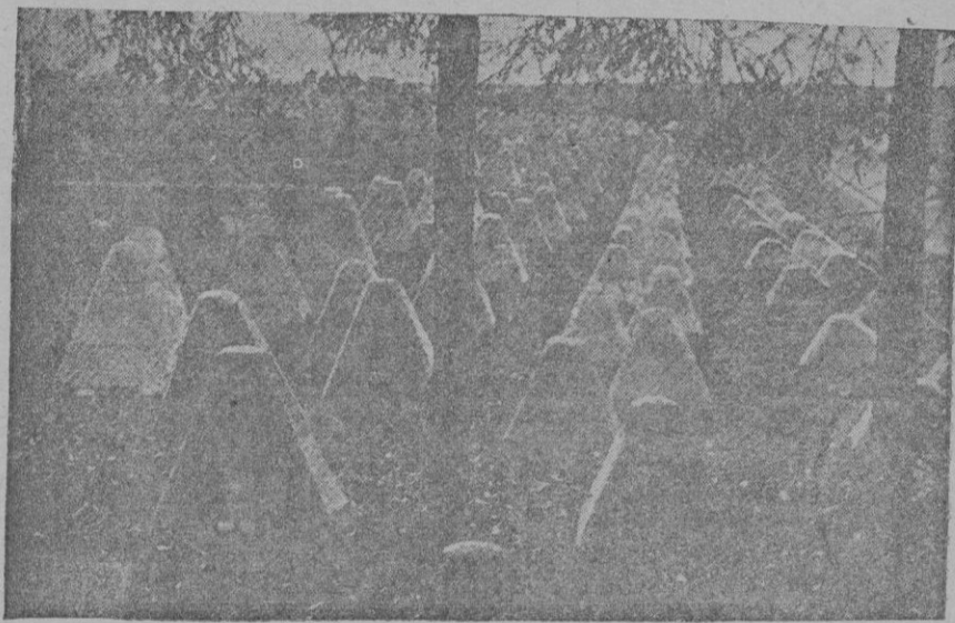
La línea Sigfrido que defiende la frontera occidental de Alemania