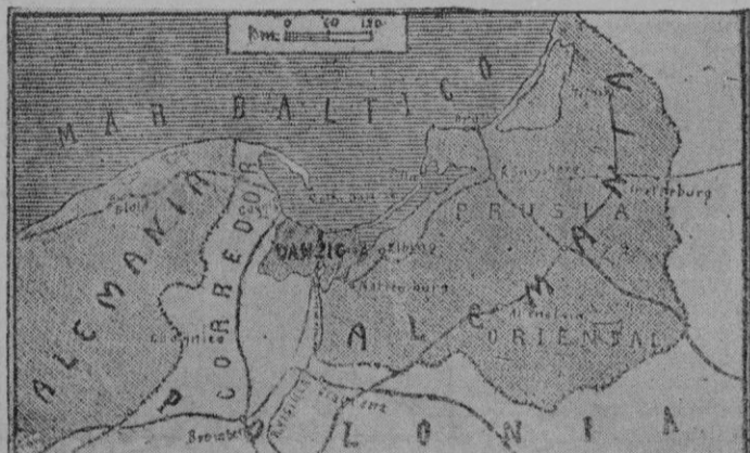
Danzig y el corredor polaco

Dos grandes trasatlánticos desembarcaron fuerzas de infantería, artillería, ingenieros y aviación, y otros buques de gran tonelaje, pertenecientes a las compañías Peninsular, Oriental y Orient Line, están descar-