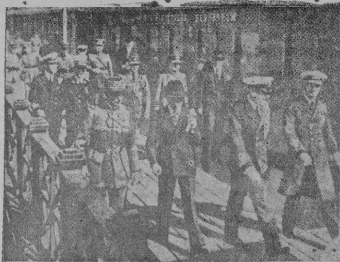
Llegada a Moscov de las misiones militares anglo-francesas

ragoza, permaneciendo en ella unos días y convirtiendo a los infieles. Ocho de los conversos, para conocer mejor el reino de Dios, salían de la ciudad todas las noches y se iban a las orillas del Ebro, donde descansaban. Después del descanso, oraban y meditaban acerca de las cosas que habían dejado el bullicio del mundo. Pasaron varias noches de esta manera, y estando el apóstol a media noche oyeron las voces de los ángeles cantando el "Ave María" y el Oficio de Maitines de la Santa Virgen. Se puso de rodillas el apóstol para reverenciarla, y se le apareció la Madre de Dios en carne mortal, acompañada de coros angélicos que traían su imagen sagrada y una columna de jaspe, y le dijo, acabados los Maitines: "Hijo Santiago: Este es el lugar donde labrarás mi casa. Toma este pilar, que ha enviado del cielo mi Hijo, tu Maestro, para que permanezca aquí hasta el fin del mundo, y aquí por virtud de mi Hijo, se obrarán grandes milagros". El