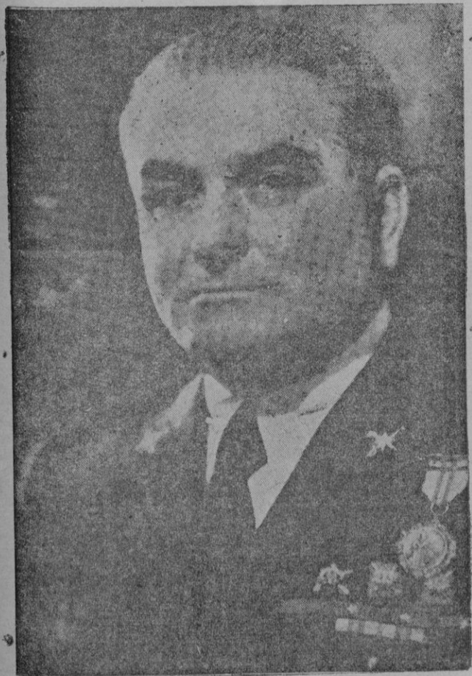
El general Gambara, que ha sido nombrado Embajador de Italia en España. — El nombramiento del general Gambara, que luchó a nuestro lado, ha sido recibido con gran satisfacción

Las salidas, de Palma y de Barcelona simultáneamente, serán los domingos, lunas, miércoles y viernes.