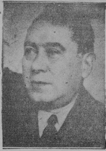
El compositor Turina que ha sido elegido miembro de la Academia de Bellas Artes

En cuanto a que los actuales edificios de Correos y Telégrafos no son suficientemente decorosos, poco ha-