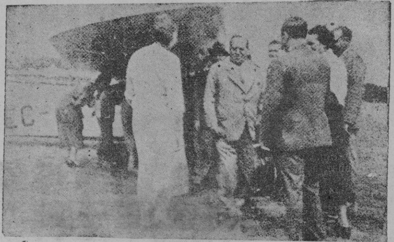
Una fotografía histórica. — Heccha el 20 de Julio de 1936, cuando el general Sanjurjo iba a subir en Storil a la avioneta para unirse al Glorioso Alzamiento. A los pocos momentos la avioneta caía y en ella moría Sanjurjo. Gran pérdida nacional