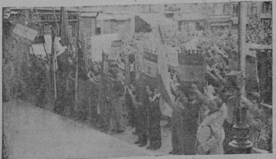
Aspecto imponente que ofrecía la Plaza de Cort, en la tarde del día 18, durante la celebración del acto de la C. N. S.