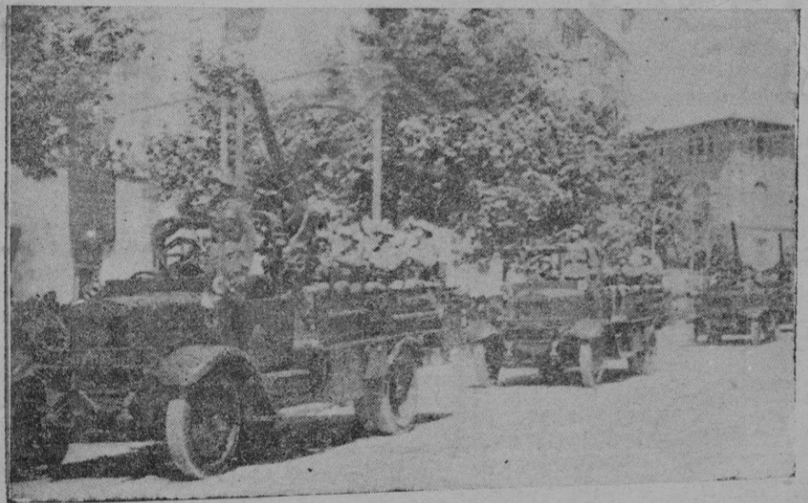
Los cañones antiaéreos en el desfile militar del día 18