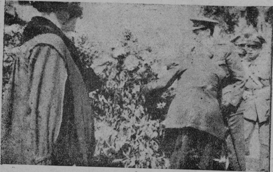
Momento de colocar ayer mañana el Alcalde de Palma, la corona de flores en la Cruz de los Caídos, dedicada a la memoria del General Goded.