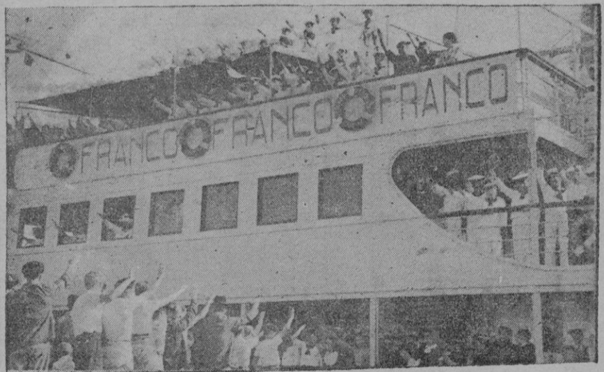
El "Ciudad de Alicante" al llegar a nuestro puerto, con los Flechas Navales

Actos a bordo y en la Cruz de los Caídos