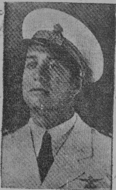
EL PALACIO DE PEDRALBES

Barcelona le tributa un grandioso recibimiento