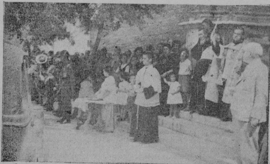
La fiesta de San Cristóbal. — Bendición de autos, frente a la iglesia de San Francisco

Un verdadero éxito lo constituyeron las sesiones celebradas ayer con la proyección de la película Fox "El rey millonario" interpretada por George O'Brien y "La gran atracción" por Harry Piel.