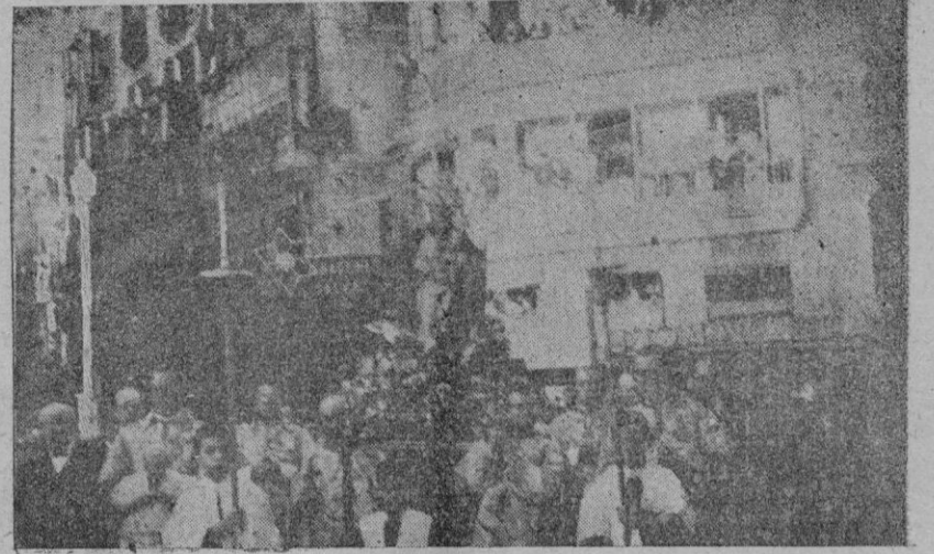
De la procesión de ayer tarde. — La Virgen de la Salud al pasar por la plaza de Cort

podemos llamar oficial conduciendo a las imágenes al principio indicadas acompañadas de miles de fervorosos fieles de las respectivas localidades de su procedencia. En un coche salón convertido en artística capilla iban la de San Salvador de Artá y la de Bonañ de Petra con las autoridades respectivas y en otro coche salón convertido como el anterior en capilla, las de San Salvador de Felanitx y la del Oratorio de Cura acompañadas una y otra no solo de las autoridades sino de las escolanías de uno y otro Oratorio. La entrada del tren en el andén fué triunfal; un clamorero de miles de personas dando vivas y aplausos llenaron el espacio durante largo rato, demostración del entusiasmo por el acto de fe que se estaba celebrando y de honor a las veneradas Virgenes. Colocadas las imágenes en la improvisada capilla de la Estación, el Director de los Ferrocarriles señor Blanes Tolo se colocó a sus pies un artístico ramo de flores ofrenda del personal de los talleres de la Compañía, acto que resultó verdaderamente emocionante.