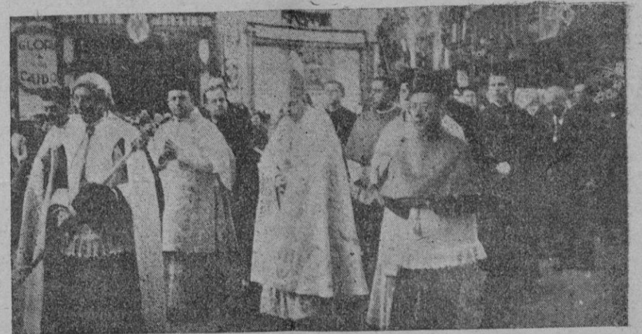
El Arzobispo-Obispo de Mallorca presidiendo la procesión

formadas de centenares de devotos de los pueblos y de Palma que se agolparon a las mismas. Seguendo a las comitivas iban las autoridades antes indicadas, hasta la Plaza de España que las dejaron para ir a esperar las demás imágenes que en caravana debían llegar por carretera. Si grande había sido la manifestación de entusiasmo y fervor, no fué menor a su entrada en la ciudad. Su paso por las calles de Palma fué verdaderamente triunfal. A la llegada a los templos fueron recibidas a la puerta por el clero de los respectivos templos cantándose una vez colocadas en los altares devotos salmos y una Salve en acción de gracias por su llegada y una misa. Todo Palma desfilaron por los templos en que quedaron expuestas las imágenes de las Virgenes. Todas y cada una de ellas se vieron nonradas con la visita de miles de devotos que acudieron a ofrecerles sus plegarias e implorar sus gracias, pudiendo afirmarse que no hubo ni un solo momento en que el desfile quedara interrumpido.