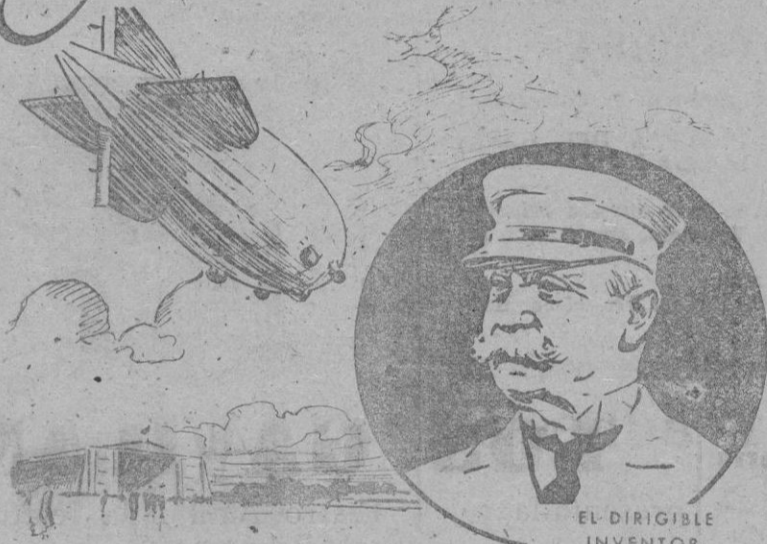
EL DIRIGIBLE INVENTOR CONDE DE ZEPPELIN 1838-1917

Todos los grandes inventos son fruto de ideas luminosas. Existen en el universo materias y energías, que utilizadas con el acierto de una feliz idea producen efectos asombrosos. He aquí el secreto de la INSTANTINA, combinación especial de eficacísimos elementos terapéuticos, inocuos y seguros, que cortan con la máxima rapidez los resfriados y sus consecuencias así como toda clase de dolores.