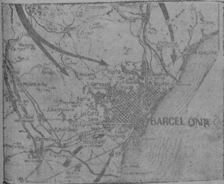
Las flechas indican el curso de los Ejércitos nacionales en la gloriosa conquista de Barcelona

De Orden de S. E., el General Jefe de Estado Mayor, Francisco Martín Moreno.