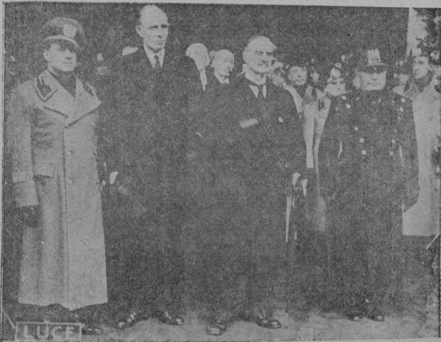
Mr. Chamberlain, Lord Halifax, Mussolini y el Conde Ciano, al salir de la estación de Termini (Roma)