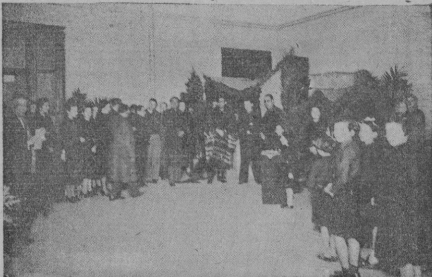
Inauguración anoche del Nacimiento en el local de Flechas Femeninas (calle de Fortuny)

El gracioso incidente truecense pronto en incontenible amargura. Descompasadamente, vuelve su imaginación a las obscuridades de la cárcel, a las viglias en la soledad y el pánico. a los tribunales grotescos y a la chérra Yafia. Siguiendo su estela, me extravió pronto en mi meditación que debiera ser la meditación de cada uno. Pienso sobre este mismo diálogo que otro tiempo hubiérase deslizado en ameno cuchicheo en invención de aventurar picaresca. ¿Qué dura la enseñanza de la guerra! Sobre ese horizonte de familias amputadas, de conciencias y pueblos