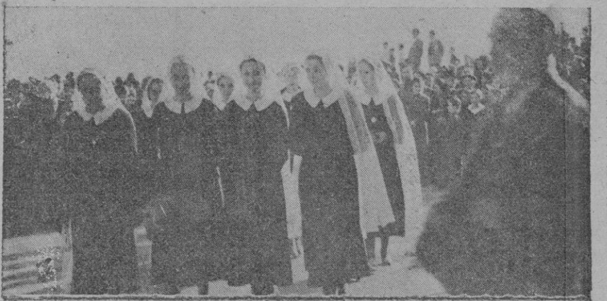
Desfile de los colegios ante la Cruz de los Caídos

Es un criterio que debía haberse seguido desde el principio, desde que se iniciaron las maniobras para imponer el confusiónismo y escamotear la verdad en el ambiente internacional.