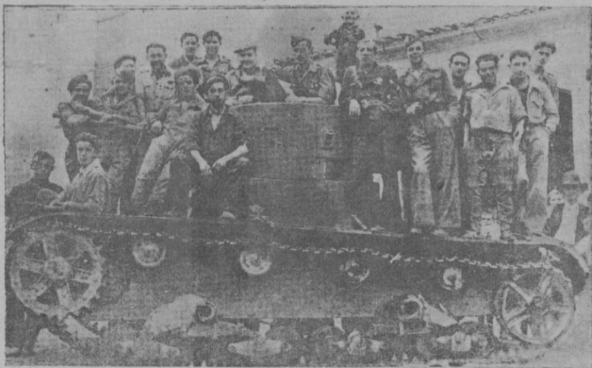
Tanque ruso capturado por nuestras fuerzas

Hace pocos días pudo ver el lector una nota de la "Cámara de la Propiedad Urbana" en la que se desis-