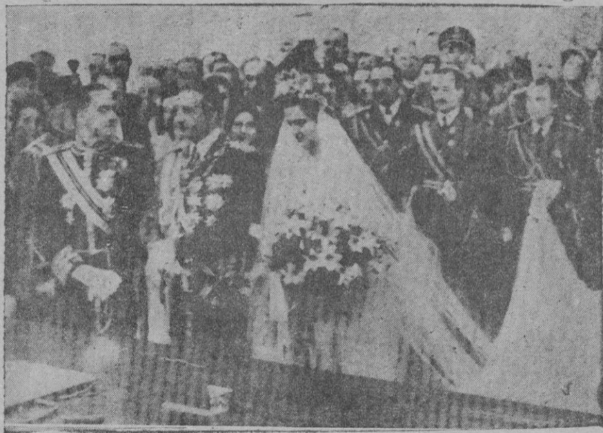
La ceremonia de la boda del Rey de Albania con la condesa Geraldina

"Roma condita"! La Ciudad fundada. Esta fecha marca una de las augustas edades del mundo. Este día fausto promovió una sucesión de siglos nuevos. De esta data imponente ha brotado un ancho y profundo raudal de historia humana. Roma fundada es el más solemne hito puramente terreno de la senda que la humanidad ha recorrido sobre el mundo. Ella ha medido una gran parte del cansado camino que los hombres anduvieron sobre la tierra. Y cuando el Tiempo, anciano divino, se irguió vigorizado de nuevo (como Elías con la fortaleza del pan cocido en el rescoldo se levantó de la sombra del enebro) para caminar otra suerte de jornadas, preside y vigila las nuevas vías la eterna Roma, heredera del imperio de los años, reina perenne de los ho-