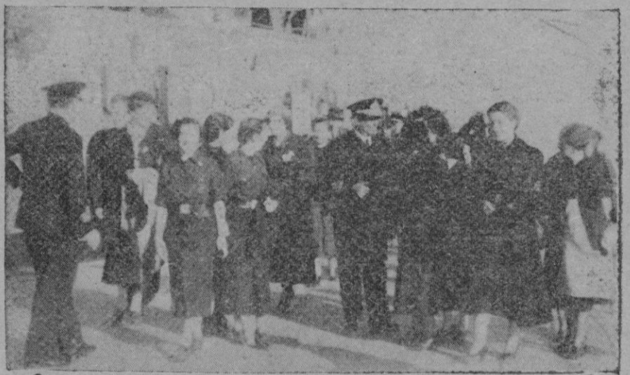
Grupo de Falangistas en el momento de llegar a bordo de uno de nuestros cruceros para entregar el Aguinaldo del Marino al Almirante de la Escuadra